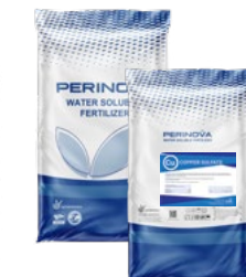
Copper Sulfate Penta Hydrate 25% Cu, 32% SO 3 سولفات مس پنتا هیدرات