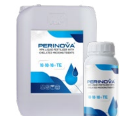
Liquid NPK 18-18-18+TE