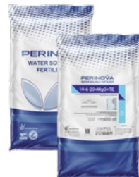
Water Soluble NPK 19-6-20+MgO+TE