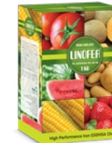
Fe-EDDHSA 6% 0 - 0 1.5%