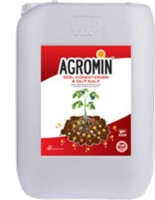
Soil Conditioner Out Salt بهبود دهنده خاک و ضد شوری