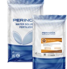
Zinc Sulfate Mono Hydrate 35% Zn, 45% SO 3 سولفات روی مونو هیدرات