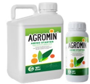
Amino Starter آمینو استارتر