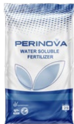
Potassium Nitrate (NOP) 12-0-44 نیترات پتاسیم گرید کشاورزی