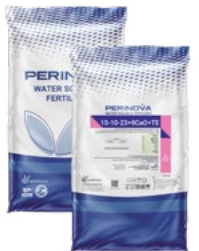
Water Soluble NPK 15-10-23+8CaO+TE