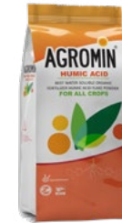
Humic Acid 75% HA, 15% FA, 12% K 2 O هیومیک اسید