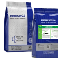
Calboron 30%CaO, 1%B