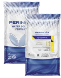
Water Soluble NPK 10-52-10+TE