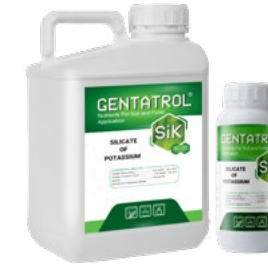
SiK 0-0-15+30% SiO 2