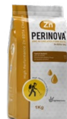
کلات روی Zn-EDTA 15%