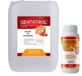
SK 0-0-30+40% S