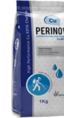
کلات مس Cu-EDTA 15%