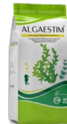
Seaweed Extract عصاره جلبک دریایی