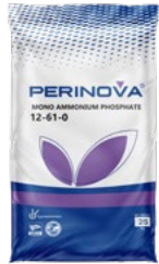
Mono Ammonium Phosphate (MAP) 12-61-0 مونو آمونیوم فسفات