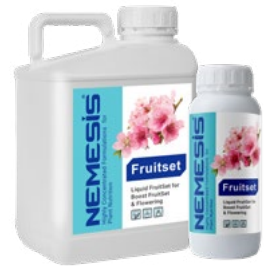
Fruit Set (N, Zn, B, Mo, Fe, Mn, Cu,...)