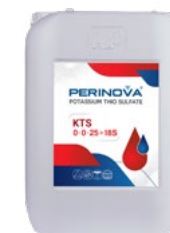
Potassium Thio Sulfate (KTS) 0-0-25+18S