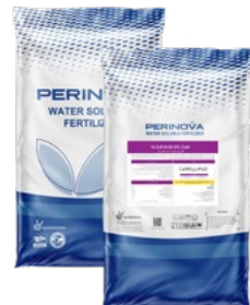
Calcium Nitrate Tetra Hydrate (CN) 12-0-0 + 23% CaO کلسیم نیترات تتراهیدرات