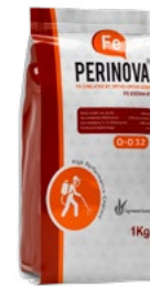
Fe-EDDHA 6% 0 - 0 3.2%

Fe-Chelate Fertilizers: Include high purity Iron chelated with EDDHA and EDDHSA