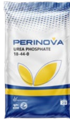
Urea Phosphate (UP) 18-44-0 اوره فسفات