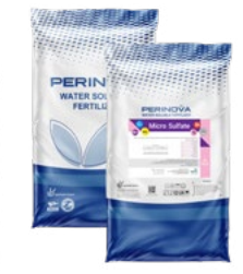
MICRO SULFATE (N, Mg, Fe, Zn, Mn, Cu, B, Mo, AA, FA) میکروسولفات