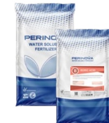
Boric Acid 17% B بوریک اسید