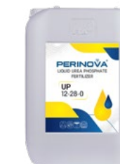
Liquid Urea Phosphate (UP) 12-28-0