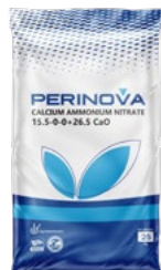
Calcium Ammonium Nitrate (CAN) 15.5 -0-0 + 26.5% CaO کلسیم آمونیوم نیترات