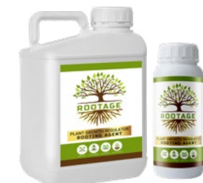
Rooting Agent Complex روتیج کمپلکس ریشه زایی