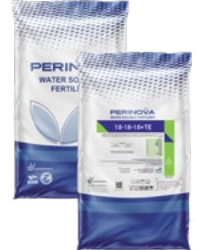
Water Soluble NPK 18-18-18+MgO+TE