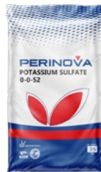
Potassium Sulphate (SOP) 0-0-52+46% SO 3 سولفات پتاسیم