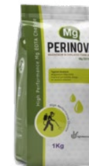
کلات منیزیم Mg-EDTA 6%