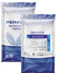
Water Soluble NPK 20-20-20+TE