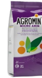
Micro Amin میکرو آمین