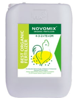
کود آلی غنی شده مایع 4-3-2+TE+28%OM