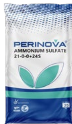
Ammonium Sulphate (AS) 21% NH 4 , 24% S سولفات آمونیوم