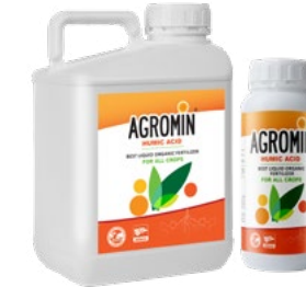
Humic Acid 16% HA, 6% FA, 3% K 2 O هیومیک اسید مایع