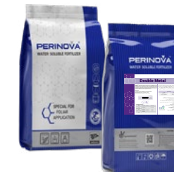
Double Metal 12%Zn, 12%Mn