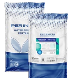
Granular Slow Release NPK 10-10-10+8 OM