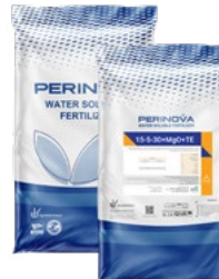
Water Soluble NPK 15-5-30+MgO+TE