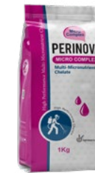
کلات میکروکمپلکس (4Fe, 4Zn, 3Mn, 2Cu, 1B, 0.05 Mo)