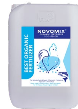
کود آلی غنی شده مایع 7-3-3+TE+25%OM