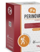
Fe-EDDHA 6% 0 - 0 4.8%