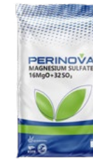
Magnesium Sulfate Hepta Hydrate (MgS) 16% MgO, 32% SO 3 سولفات منیزیم هپتا هیدرات

PERINOVA® Basic Fertilizer Materials (Micro Elements): Include high purity micro elements fertilizers.