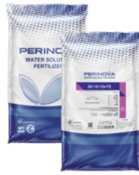
Water Soluble NPK 30-10-10+TE

PERINOVA® Compound Fertilizers: Includes mixed Nitrogen, Phosphorus, Potassium plus Micronutrients