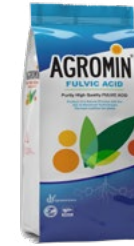
Fulvic Acid 95% فولویک اسید