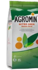
Amino Acid 80% نیتروآمین