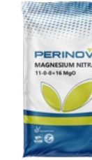
Magnesium Nitrate Hexa Hydrate (MgNit) 16% MgO, 11% NO 3 نیترات منیزیم هگزا هیدرات