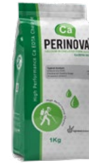
کلات کلسیم Ca-EDTA 10%

Chelated Fertilizers: Include high purity elements chelated with EDTA