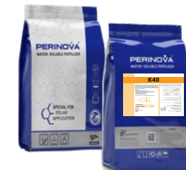
K40 40% K 2 O