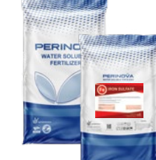
Iron Sulfate Hepta Hydrate 20% Fe, 28% SO 3 سولفات آهن هپتا هیدرات