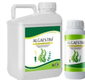
Seaweed Extract عصاره جلبک دریایی مایع