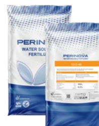
Water Soluble NPK 10-0-48