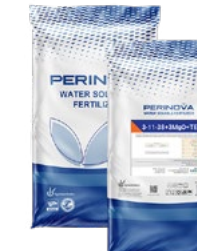
Water Soluble NPK 3-11-38+3MgO+TE