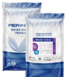
Granular Slow Release NPK 5-5-5+25 OM