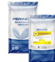
Sodium Molybdate 38% Mo مولیبدات سدیم