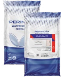
Water Soluble NPK 12-12-36+TE