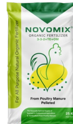
پلت مرغی جامد 3-3-2 Poultry Manure Pelleted