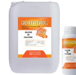
SCa 13% S+6% CaO