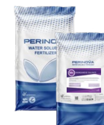
Manganese Sulfate Mono Hydrate 32% Mn, 45% SO 3 سولفات منگنز مونو هیدرات