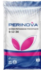
Mono Potassium Phosphate (MKP) 0-52-34 مونو پتاسیم فسفات