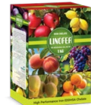
Fe-EDDHSA 6% 0 - 0 3%