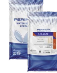
Water Soluble NPK 5-10-45+TE