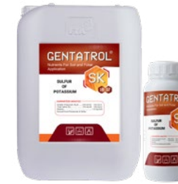
SK 0-0-12+18% S