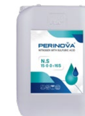
Nitrogen With Sulfuric Acid (N.S) 15-0-0+16S