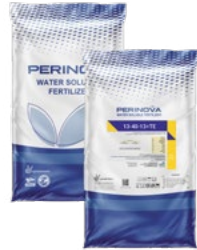
Water Soluble NPK 13-40-13+TE