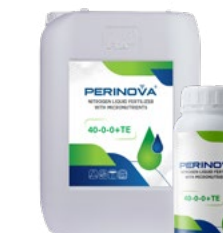
Liquid Nitrogen 40-0-0+TE