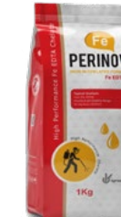
کلات آهن Fe-EDTA 13%