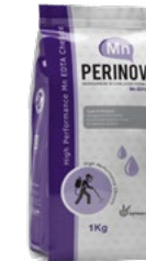
کلات منگنز Mn-EDTA 13%